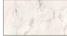
29 Calacatta chiaro