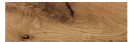
Rovere Naturale / Natural Oak