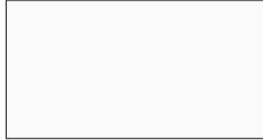
05 Bianco Opaco